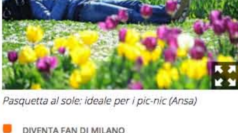
Pasquetta al sole: ideale per i pic-nic

Gusto, arte e musica ma anche mercatini, spettacoli teatrali e concerti in agenda per venerdì 1, sabato 2 e domenica 3 aprile