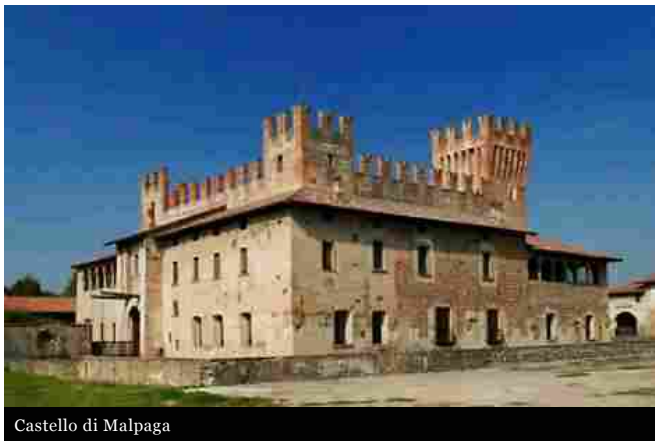
Castello di Malpaga

Dopo lo straordinario successo della prima apertura, che ha visto più di 3500 turisti affollare i borghi e i castelli della pianura bergamasca, tornano lunedì 6 aprile