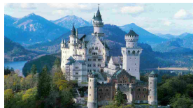
Neuschwanstein: come in un vero castello Disney