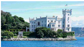
Visitare il castello di Miramare a Trieste