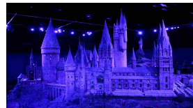
Il castello di Hogwarts a Leavesden!