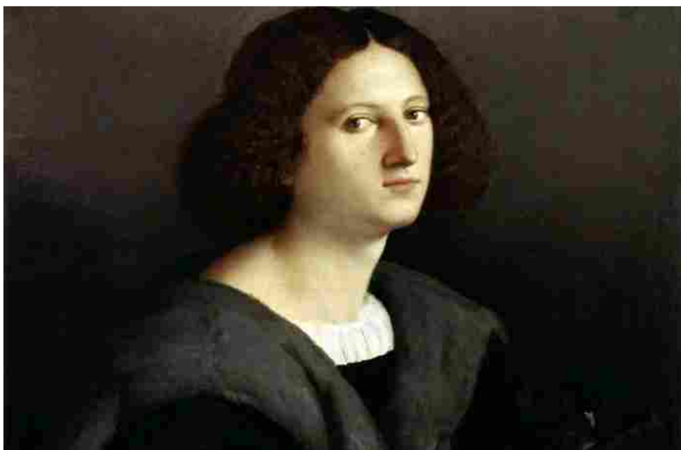
Palma il Vecchio, Ritratto d'uomo, 1512-1515, olio su tela, San Pietroburgo, Hermitage-Archivio Scala