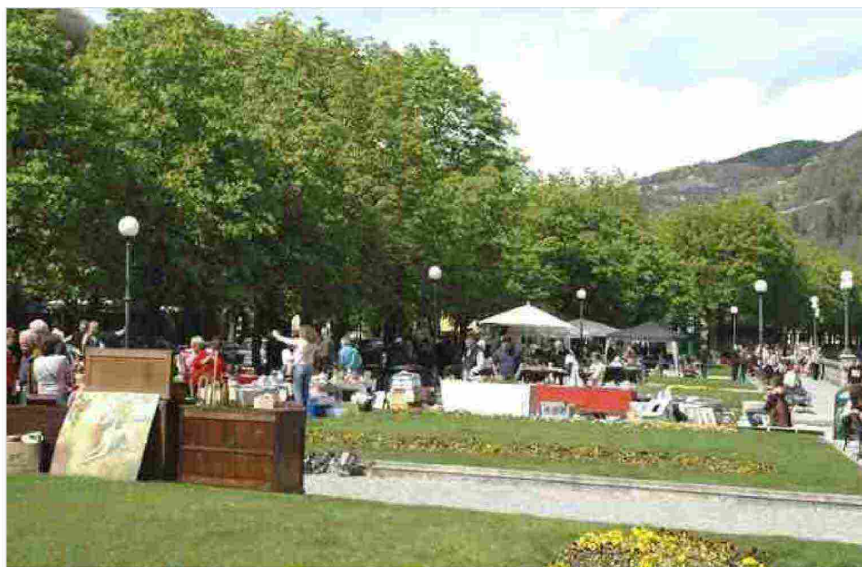
Il mercatino a San Pellegrino