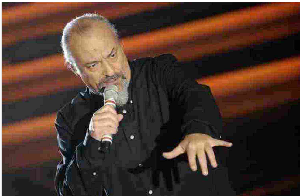
Eugenio Finardi cantante