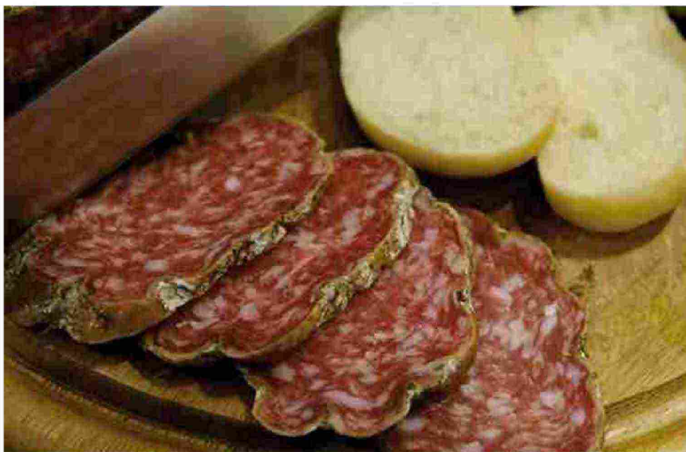
Salame, c'è la sagra

Continua la festa dell'oratorio in programma fino al 16 giugno. Tutte le sere apertura del servizio ristoro.