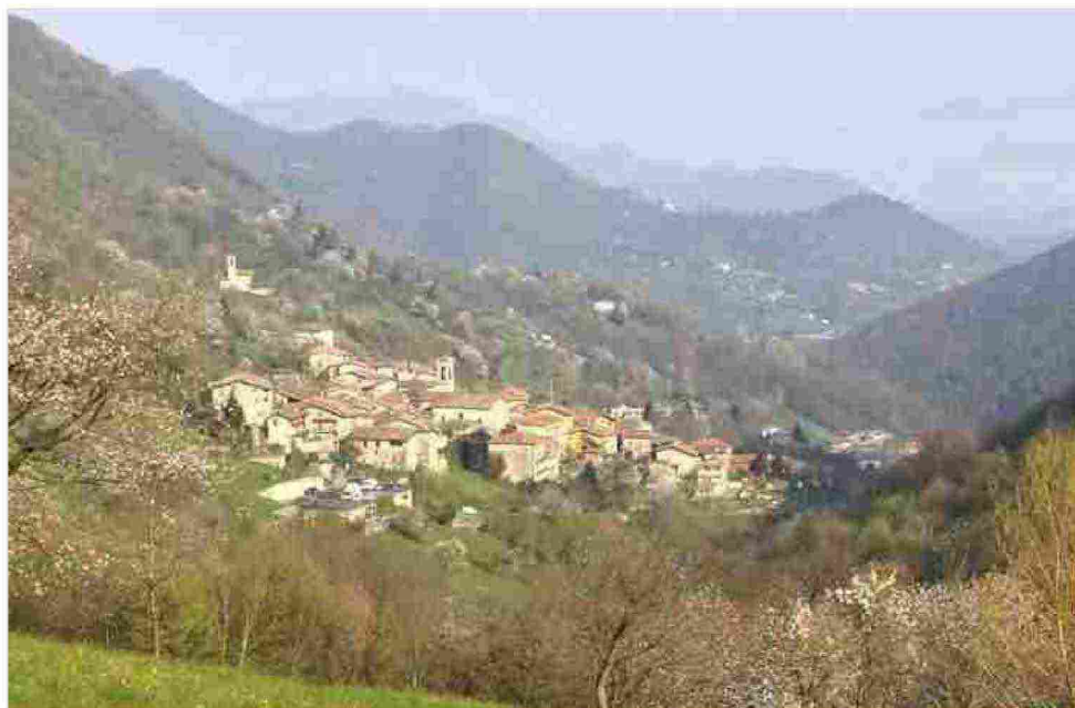
Un panorama di Olera

Con ritrovo in piazza, visita guidata gratuita al borgo e alle chiese, con capolavori assoluti come il polittico di Cima da Conegliano del '400.