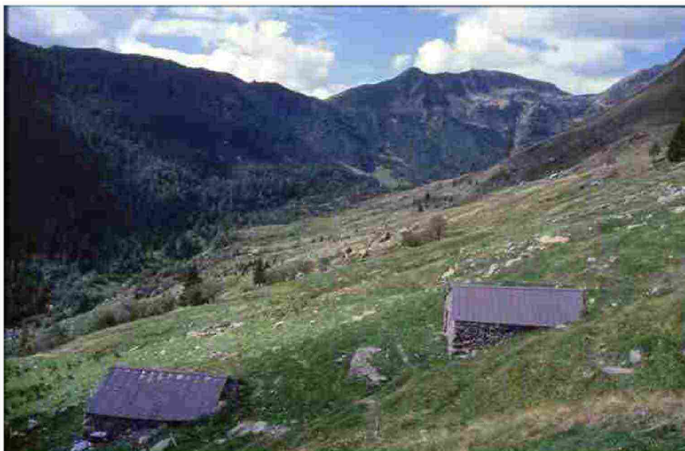
Baite in Valsanguigno

Visite guidate per conoscere i tesori della Valsanguigno. Iniziativa a pagamento, obbligatoria l'iscrizione allo Iat Valserinana e Val di Scalve: 035.70.40.63.