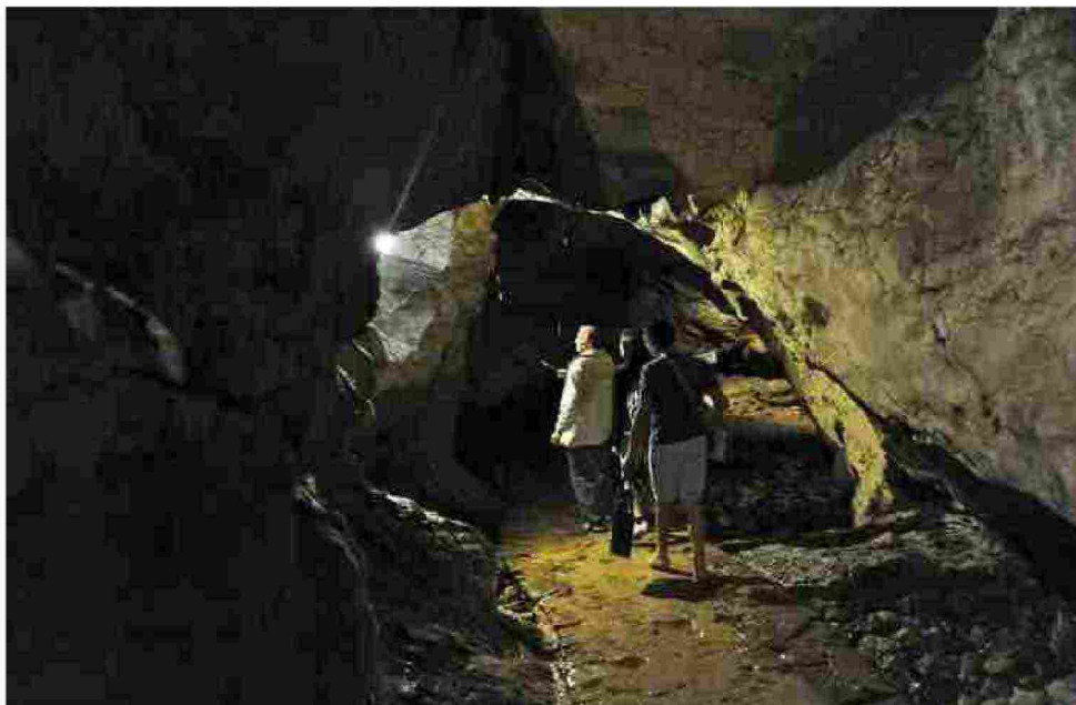
La Buca del Corno a Entratico.