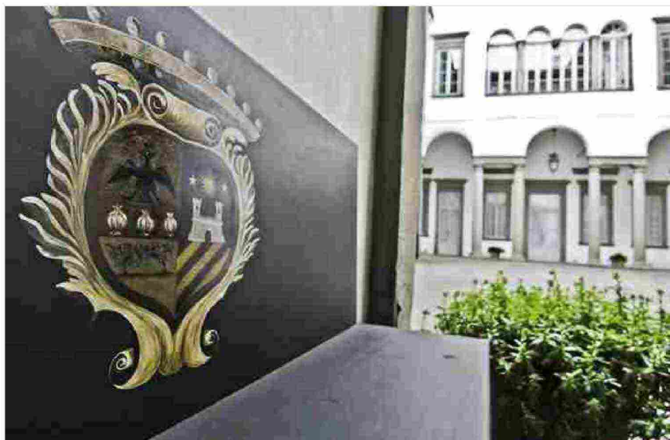
Palazzo Agliardi a Bergamo

In concomitanza con la mostra dedicata a Palma il Vecchio, apertura al pubblico delle dimore storiche di Bergamo con visite guidate: Palazzo Agliardi (via Pignolo 86) da martedì a venerdì ore 16, sabato e domenica ore 16 e 17,15; Palazzo Moroni (via Porta Dipinta 12), domenica ore 15; Luogo Pio Colleoni (via Colleoni 11), sabato ore 15 e 19 e domenica ore 10 e 18; Villa Pesenti-Agliardi di Sombreno Paladina (via Agliardi 8), su prenotazione; e il Castello di Malpaga, a Cavernago (via Marconi 20), domenica ore 16.