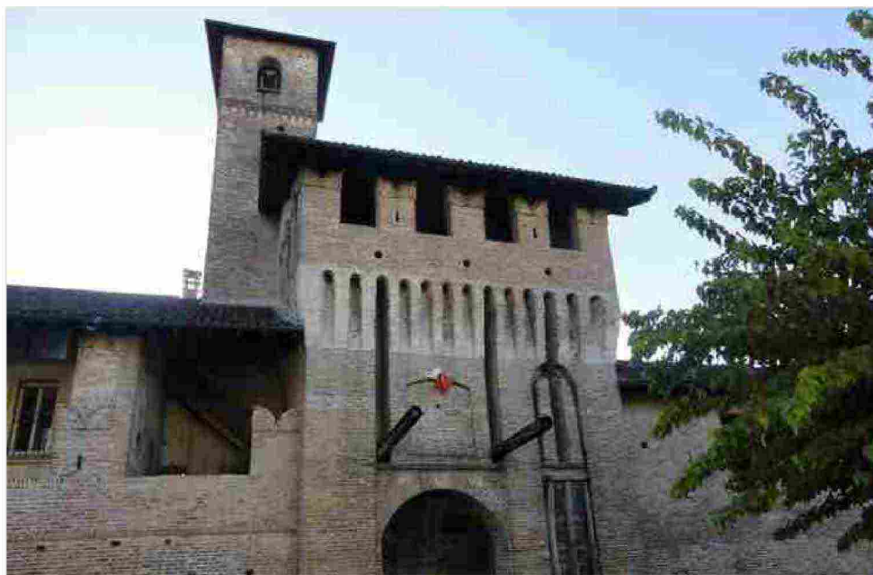
Il castello di Pagazzano

Si possono visitare: il castello di Pagazzano ore 9-12 e 14,30-18,30, ultimo ingresso ore 11,30 e 18 (costo 3 euro, gratis fino ai 12 anni); castello di Malpaga ore 10-18, ultimo ingresso ore 17 (costo 7 euro per adulti e 3 euro per bambini dai 6 ai 12 anni, gratuito fino a 5), Borgo di Cologno con visite guidate dalle 10 alle 12 con ingressi alle 10 e alle 11 (costo 3 euro, gratis fino ai 12 anni); Martinengo visite guidate dalle 10 alle 12 e dalle 15 alle 17, ingressi alle 10,30, 11, 11,30, 15, 15,30, 16, 16,30 (costo 3 euro, gratis fino ai 12 anni); Borgo di Romano con visite guidate dalle 15 alle 17, partenze alle 15 e alle 15,30 e alle 16 (costo 3 euro, gratis fino ai 12 anni); Rocca di Ugnano con visite dalle 15 alle 17 della durata di un'ora con partenza ogni mezzora, ultimo ingresso 16,30 (costo 3 euro, gratis fino ai 12 anni); Palazzo visconteo di Brignano con visite guidate dalle 11 alle 12,30 e dalle 15 alle 17 con partenze alle 11, 11,30, 15, 15,30, 16 (costo 5 euro, gratis fino ai 12 anni). Info: Ufficio lat Pro Loco Martinengo www.bassabergamascaorientale.it - tel. 0363.986031 (dalle 9 alle 12).