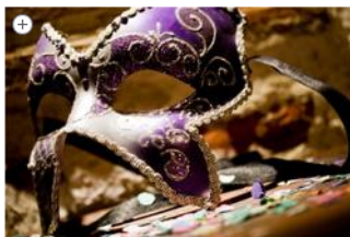
Una maschera di carnevale