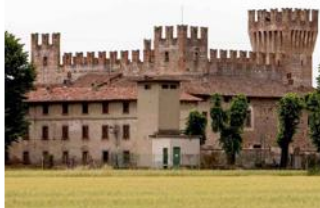
Il Castello di Malpaga

Cavernago - Malpaga - Il Castello di Malpaga riapre al pubblico per la stagione 2014 e sono numerose le iniziative che daranno vita al Borgo. In particolare è in programma la «Giornata al castello», iniziativa dedicata alle scolaresche, con attività didattiche personalizzate per scuole dell'infanzia, primarie di I° e II°, secondarie e superiori, con laboratori interattivi in costume d'epoca e visite agli impianti di energia rinnovabile.