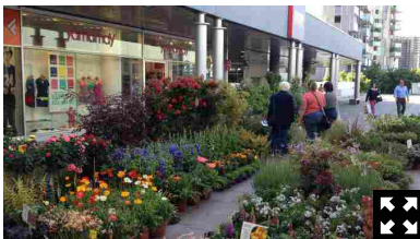
Florovivaismo in piazza Portello a Milano

Non sapete cosa fare nel weekend? Non avete progetto per il sabato sera oppure per la domenica pomeriggio. Ecco una lista di eventi in programma in tutta la Lombardia