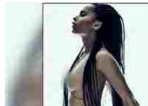
Figlia illustre, attrice, cantante e ora modella. Chi è?