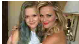
Figli delle stelle: bimbi famosi e vip sono identici