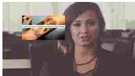
Demi Lovato ha coperto la sua 'vagina'