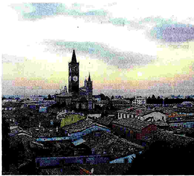
Una panoramica di Treviglio. Svelta la torre civica vicino alla basilica

Il museo civico «Ernesto e Teresa Della Torre», aperto sabato dalle 15 alle 18 e domenica dalle 10 alle 12,30 e dalle 15 alle 18, conta dipinti e sculture di valore del XV e XVI secolo: negli stessi orari sarà visitabile anche la confinante Sala Crociera del Centro civico con le opere di artisti trevigliesi. Palazzo Galliari sarà aperto per mostrare la sua caratteristica architettura seicentesca, sabato dalle 14 alle 18 e domenica dalle 10 alle 18.