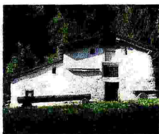
Il Mulino di Baresi

L'antico edificio rurale in pietra è stato mulino e torchio, ma anche maglio, forno e casera. Risalente al XVII secolo, per la