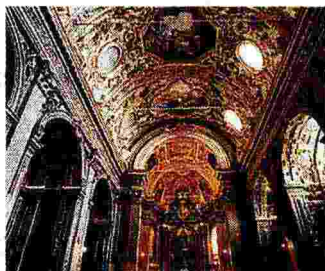
La volta della chiesa di S. Grata