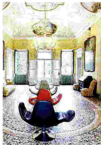
Un salone di Palazzo Agliardi

Villa Pesenti-Agliardi di Sombreno offre visite guidate e menù del Palma nelle sale della villa. Su prenotazione e