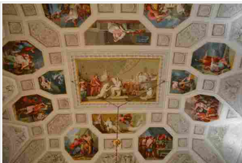
Palazzo Ginnasi Ghetti – Faenza

Clicca qui per leggere un approfondimento sul Chiostro delle Umiliate a Milano