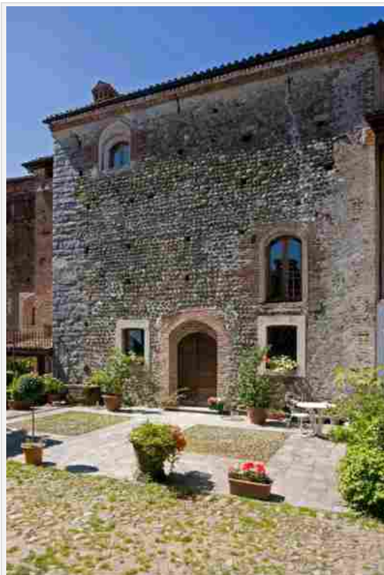
Castello di Masazza – Masazza (Biella)

In linea con l'edizione 2014, un ruolo chiave nell'ambito delle Giornate Nazionali A.D.S.I. avranno anche i maestri artigiani impegnati nella manutenzione delle dimore storiche: restauratori, corniciai, vetrai, ceramisti, marmisti, bronzisti, argentieri, orologiai, mosaicisti e pittori, mostreranno al pubblico le loro realizzazioni e daranno dimostrazioni delle loro attività. Su base regionale il programma si arricchirà inoltre di numerosi eventi culturali, quali mostre, concerti e spettacoli teatrali, con l'obiettivo di coinvolgere un vasto pubblico di ogni fascia di età.