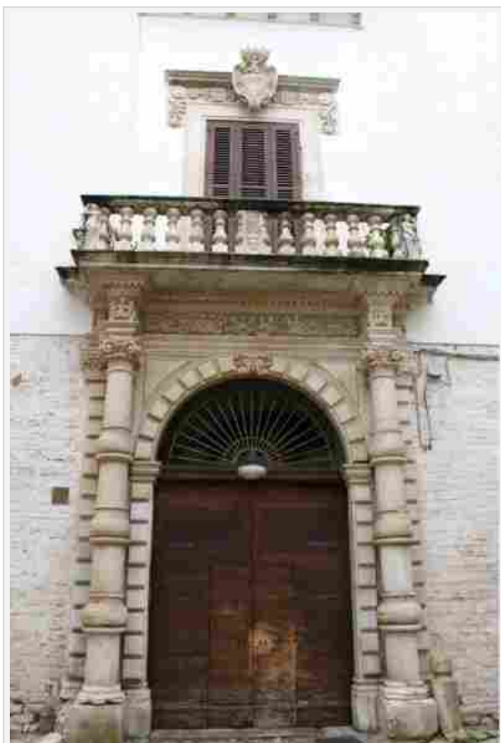
Palazzo Sylos Sersale – Bitonto

Parco Villa Kechler de Asarta – Fraforeano (Udine)