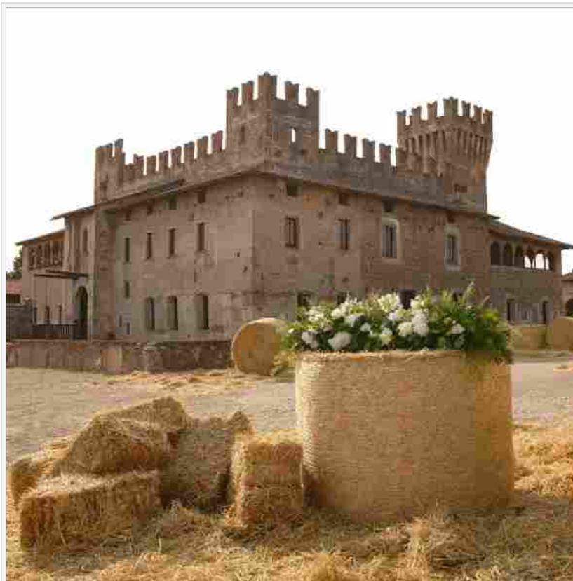
Castello di Malpaga – Cavernago (Bergamo)

<SCARICA L'ELENCO COMPLETO DELLE DIMORE CHE ADERISCONO>