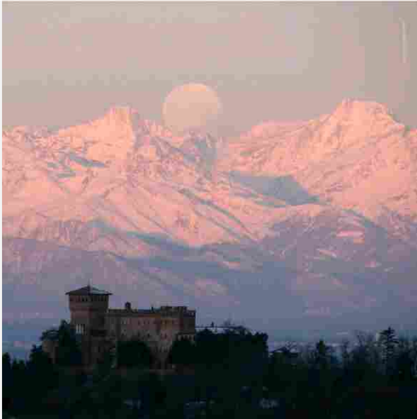
Castello di Gabiano – Gabiano (Alessandria)

L'edizione di quest'anno, che prevede l'apertura di oltre 200 dimore, si svolgerà in concomitanza con EXPO 2015 e sarà occasione anche per una riscoperta della grande tradizione enogastronomica italiana, di cui i proprietari di dimore storiche sono attenti custodi. Infatti, oltre a visitare gratuitamente cortili, palazzi, ville e giardini, usualmente non aperti al pubblico, i visitatori saranno accompagnati dai proprietari alla scoperta di affascinanti residenze di campagna, sede di aziende agricole e di cantine italiane di prestigio.