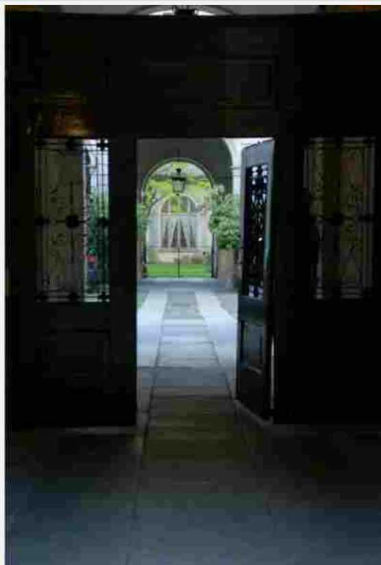
Palazzo Cornaggia – Milano