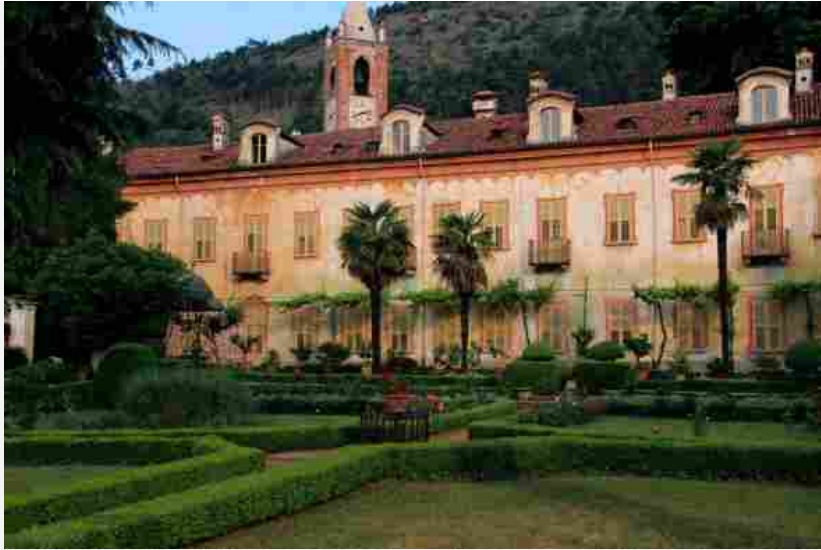
Villa Lajolo – Piosasco (Torino)

In linea con l'edizione 2014, un ruolo chiave nell'ambito delle Giornate Nazionali A.D.S.I. avranno anche i maestri artigiani impegnati nella manutenzione delle dimore storiche: restauratori, corniciai, vetrai, ceramisti, marmisti, bronzisti, argentieri, orologiai, mosaicisti e pittori, mostreranno al pubblico le loro realizzazioni e daranno dimostrazioni delle loro attività. Su base regionale il programma si arricchirà inoltre di numerosi eventi culturali, quali mostre, concerti e spettacoli teatrali, con l'obiettivo di coinvolgere un vasto pubblico di ogni fascia di età.