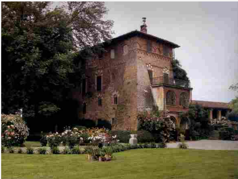
Castello di Marchierù – Villafranca

L'edizione di quest'anno, che prevede l'apertura di oltre 200 dimore, si svolgerà in concomitanza con EXPO 2015 e sarà occasione anche per una riscoperta della grande tradizione enogastronomica italiana, di cui i proprietari di dimore storiche sono attenti custodi. Infatti, oltre a visitare gratuitamente cortili, palazzi, ville e giardini, usualmente non aperti al pubblico, i visitatori saranno accompagnati dai proprietari alla scoperta di affascinanti residenze di campagna, sede di aziende agricole e di cantine italiane di prestigio.