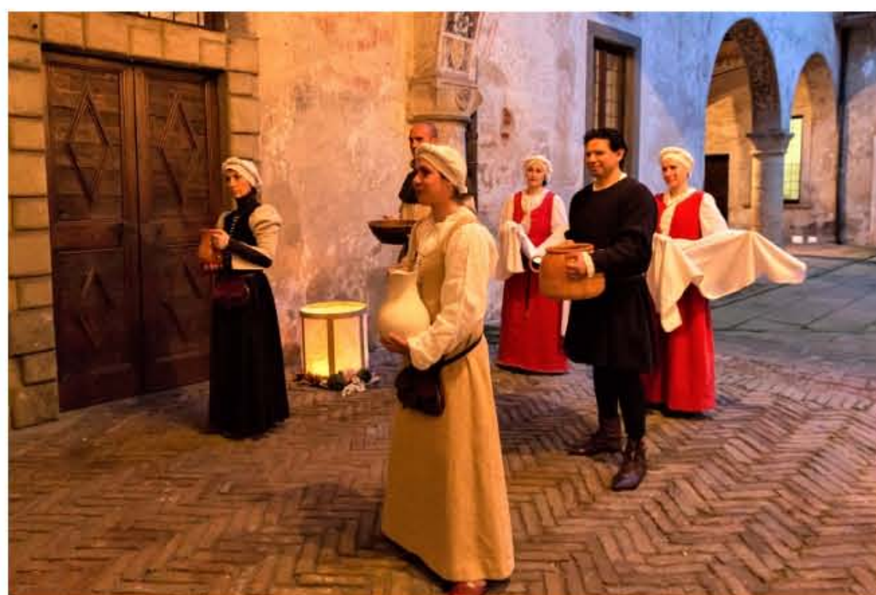
(Abiti rigorosamente d'epoca per la rievocazione)

L'appuntamento è per il 29, 30 aprile e 1 maggio al maniero di Cavernago dove ci si potrà letteralmente tuffare indietro nel tempo e per tre giorni calarsi nel magico mondo dell'arceria medioevale. Gli Arcieri DragoNero allestiranno un vero accampamento medioevale nel fossato del Castello dove, in un autentico campo da tiro, si esibiranno nell'arte dell'arceria con scoccate spettacolari. Ma non solo. Grandi e piccoli potranno provare a imbracciare un arco medioevale e a scoccare la loro prima freccia. Il 1 maggio l'evento continuerà anche nell'Antica Piazza d'Armi, dove dalle 10 si terrà una gara di arceria medioevale: tutti i partecipanti saranno in costume d'epoca e si cimenteranno in sfide all'ultima freccia. Sempre nell'Antica Piazza d'Armi i visitatori troveranno artigiani medioevali (mastro arcaio, pellettaio, tessitore, coniatore, fabbro) che mostreranno le loro abilità nelle antiche arti e spiegheranno usi e costumi dell'epoca, e per un po' di shopping non mancheranno bancarelle in cui sarà possibile comprare archi e balestre, bevande dell'epoca, ceramiche, manufatti in cuoio e legno e farsi leggere la mano da una vera cartomante. In ultimo, sempre nell'Antica Piazza d'Armi, saranno presenti aree verdi e sedute, un'area gioco per i bambini e un punto ristoro per trascorrere un'intera giornata all'aria aperta dove il tempo sembrerà essersi fermato. L'ingresso è gratuito: sabato 29 aprile dalle 14 alle 18. Domenica 30 aprile e lunedì 1 maggio dalle 10 alle 18.