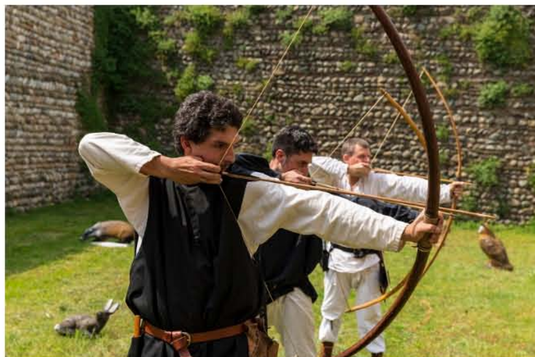
(La rievocazione in foto di repertorio)

Il Castello di Malpaga si prepara a ospitare la tradizionale rievocazione storica dell'arceria e artigianato medioevale.