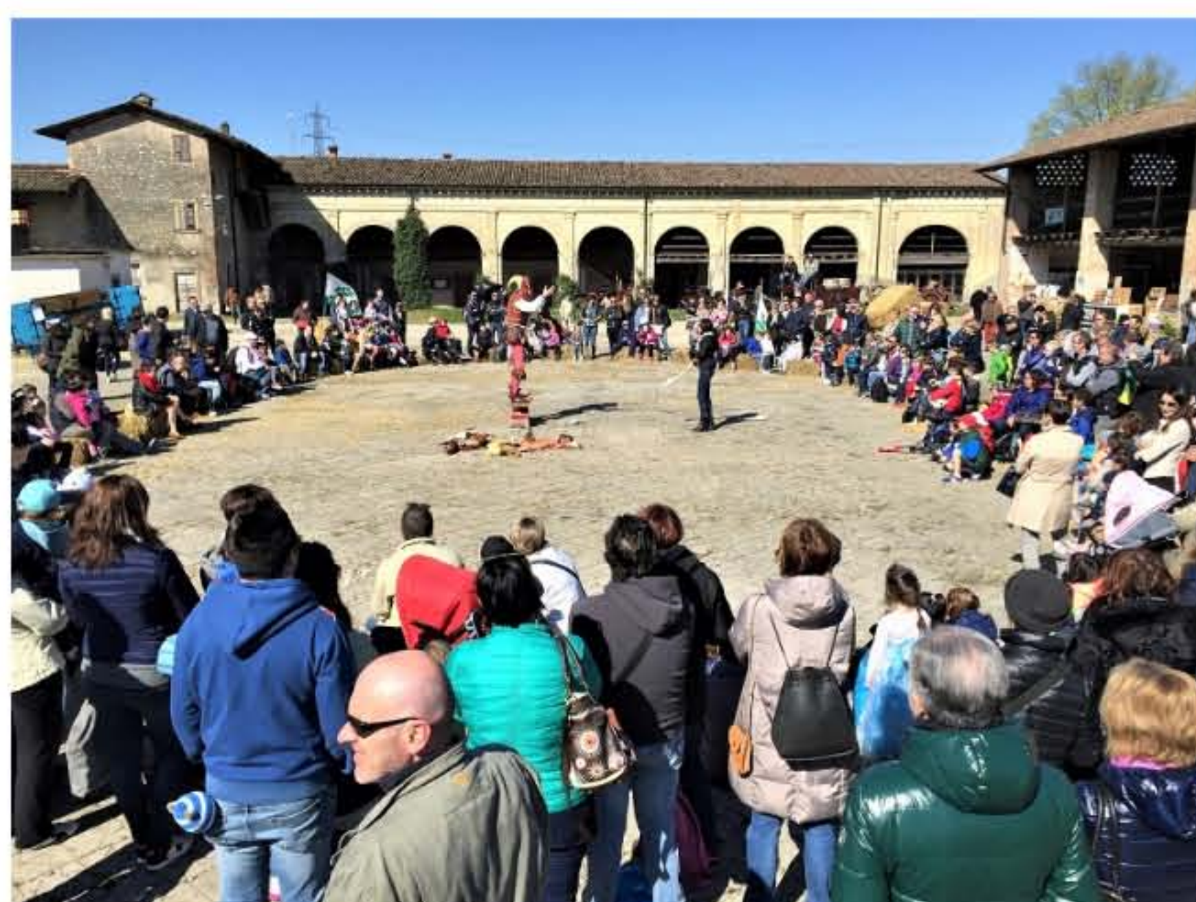
(Spazio all'aperto per le famiglie)

Il 29 aprile, inoltre, sarà possibile partecipare alla cena storica medioevale, con un menù rigorosamente dell'epoca, ritrovato in antichi manoscritti, ambientata nell'antica Sala dei Banchetti del Castello decorata con soffitto a cassettoni del 1400, affreschi del Fogolino (1500) e un antico camino perfettamente funzionante. La grande tavolata reale, dove si accomoderanno tutti gli ospiti, sarà imbandita con tovagliato di lino grezzo, arredi e stoviglie d'epoca (piatti in maiolica, bicchieri in coccio, posate di legno). Ogni piatto sarà servito su portantine di legno da camerieri vestiti in abiti medievali e verrà introdotto dal Gran Siniscalco che spiegherà la sua origine e storia allietando i commensali con curiosità sugli antichi usi e costumi. La Sala sarà illuminata con candele e camino acceso, rendendo l'atmosfera molto suggestiva. In questa occasione dopo la cena i partecipanti vivranno un momento magico e suggestivo nel cortile d'onore. La prenotazione è obbligatoria.